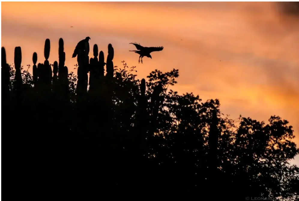
Parque Nacional Pantanal Matogrossense

Os focos de incêndio registrados no Parque Nacional (Parna) do Pantanal Mato-grossense no final do ano atingiram mais de 10 mil hectares da Unidade de Conservação. O Parna está situado no sul do estado de Mato Grosso, quase na divisa com Mato Grosso do Sul.