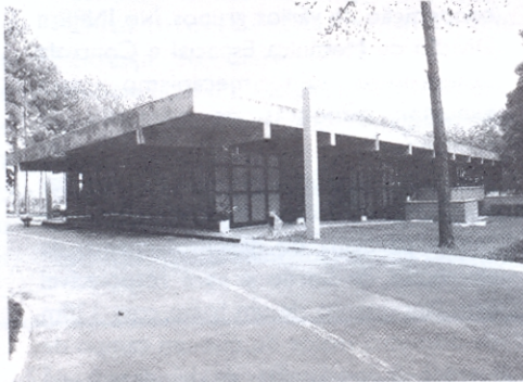
Sede do IAI no INPE

por sete temas de pesquisa: ecossistemas tropicais e ciclos biogeoquímicos; estudo dos impactos das mudanças climáticas na biodiversidade; El Niño-oscilação sul e a variabilidade climática interanual; interações terra-atmosfera-oceano nas Américas intertropicais; estudos comparativos dos processos oceânicos, costeiros e estuarinos nas zonas temperadas; estudos comparativos de ecossistemas terrestres nas regiões temperadas; e processos de altas latitudes.