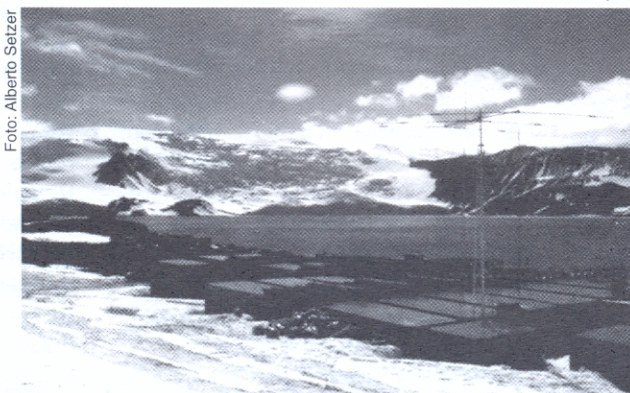
A Estação Antártica Brasileira